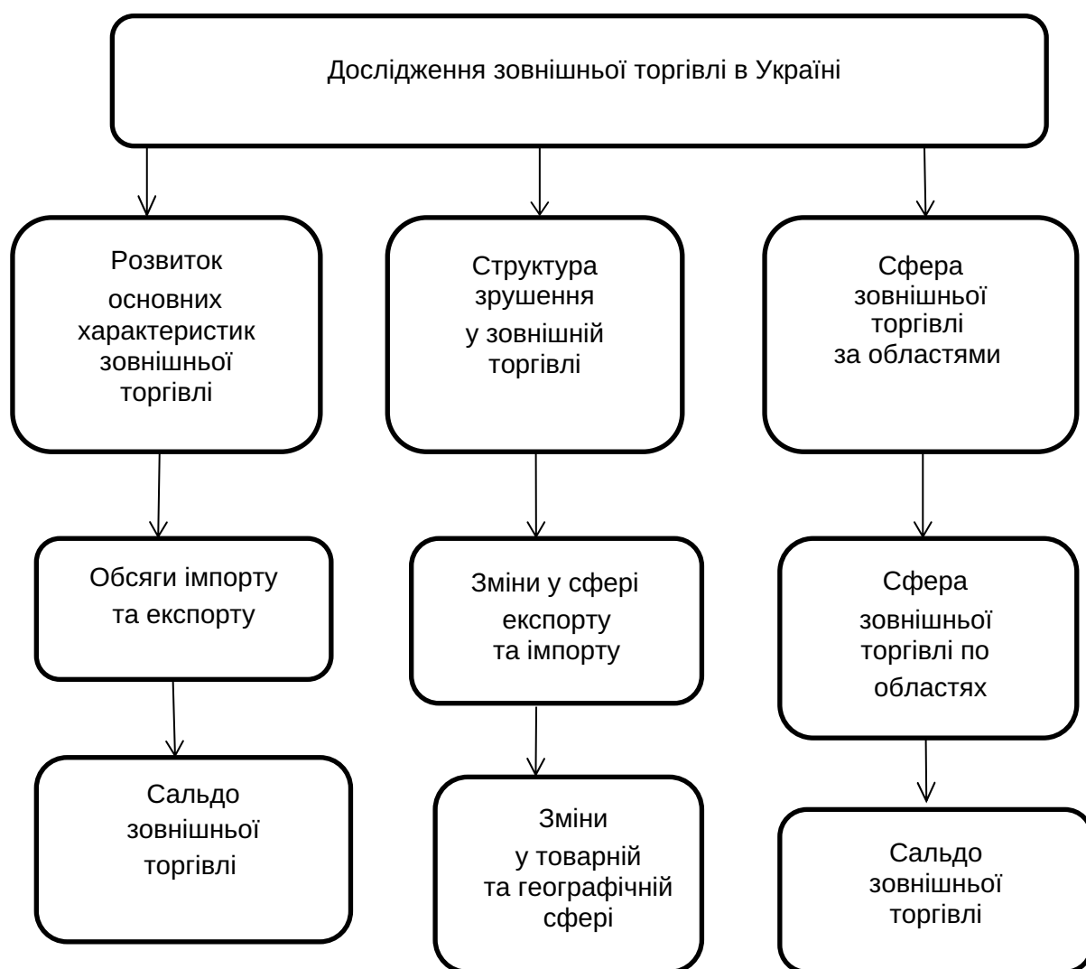
Рис. 1. Структура аналізу та визначення проблем зовнішньої торгівлі в Україні

товарів, що спричинено високими цінами на їх імпорт (табл.1). Триває негативна динаміка експорту товарів, який скоротився майже на 28% (до 25,7 млрд дол. США) випереджальними темпами проти імпорту товарів, що зменшився на 19 % (до 30 млрд дол. США) [2].