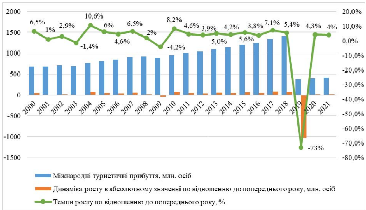
Рис. 1. Динаміка розвитку міжнародного ринку туристичних послуг [6]

сьогодні Європа є регіоном-лідером в розрізі туристичних потоків, а її частка в загальному розподілі міжнародних прибуттів становить – 67,4%. Друге місце у 2021 році займає Америка – 19,7%. Найнижчі досліджувані показники характерні для Азіатсько-Тихоокеанського регіону – 5%, Близького Сходу та Африки – майже по 4% відповідно.