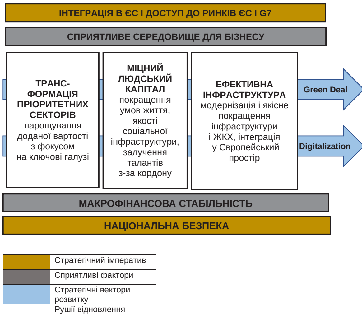
Рис. 3. Візія відновлення України: «Сильна європейська країна – магніт для іноземних інвестицій»

до 2030 року [16]. Проміжкові результати імплементації даної стратегії за даними 2021 р. свідчать, за пріоритетними напрямками виконувалося 5807 НТП (89,4% від загальної кількості НТП, що виконувалися у звітному році за рахунок загального фонду державного бюджету), створено 12389 одиниць НТП (89,2% від загальної кількості створеної НТП), впроваджено – 50,2% (6222 одиниці НТП). Найбільшу кількість НТП – 6755 одиниць (54,5% від загальної кількості створеної НТП за пріоритетними напрямками) створено за пріоритетним напрямом «Фундаментальні наукові дослідження», з них впроваджено – 3040 одиниць (45,0%). За цим напрямом створено найбільше таких видів НТП, як «Сорти рослин та породи тварин» (97,2% від загальної кількості НТП даного виду), «Матеріали» (58,3%), «Методи, теорії» (51,5%), «Види виробів» (47,8 %) [17, с. 41–42].