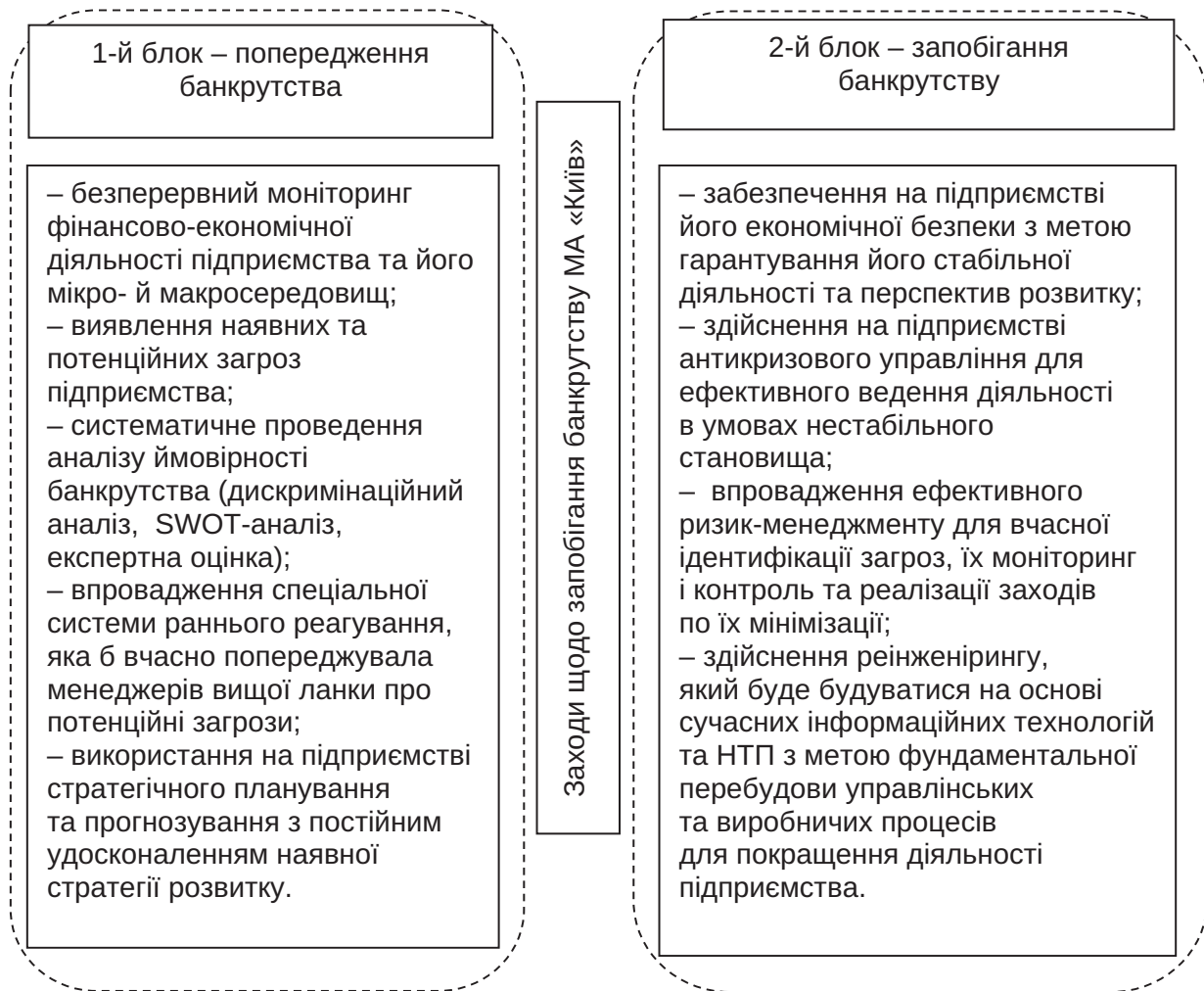
Рис. 3. Заходи запобігання банкрутству МА «Київ» (Жуляни)