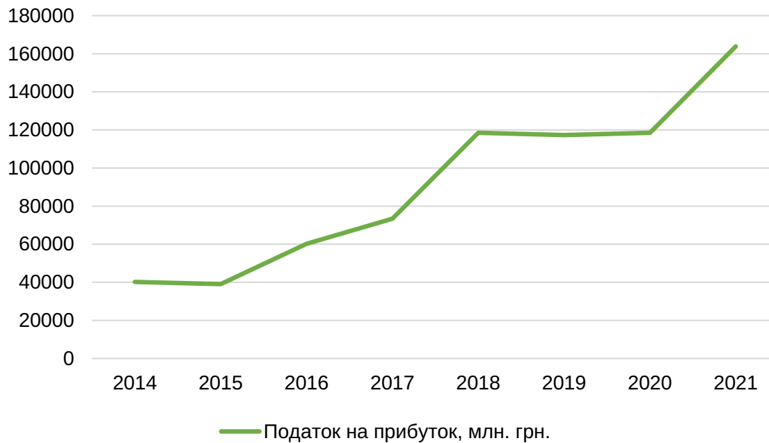
Рис. 1. Динаміка надходжень податку на прибуток підприємства до зведеного бюджету України у 2014–2021 роках