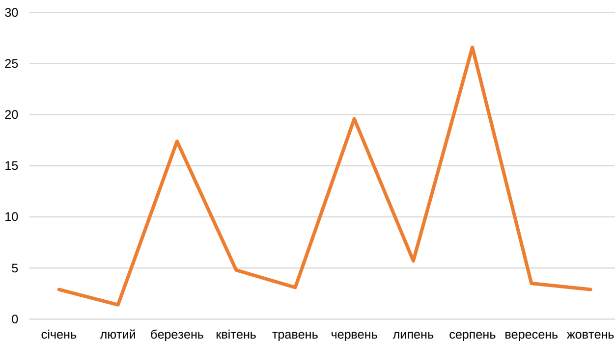
Рис. 2. Динаміка щомісячних надходжень податку на прибуток до Зведеного бюджету України у 2022 році