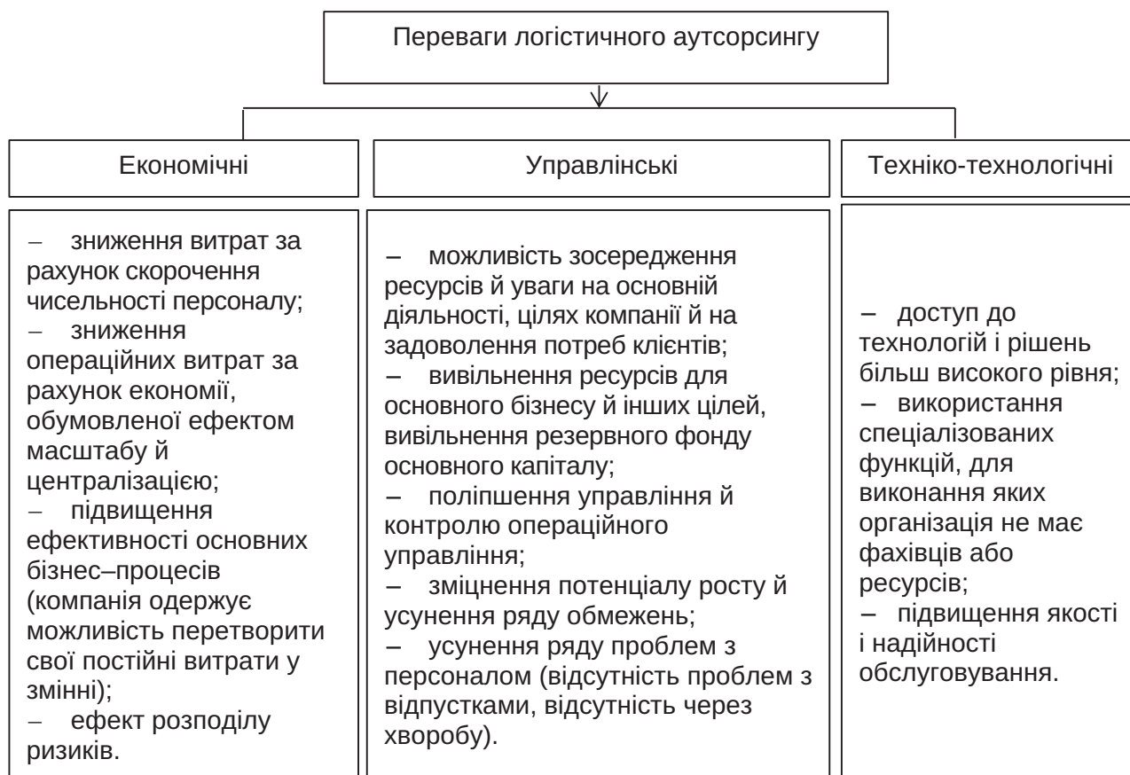
Рис. 3. Переваги логістичного аутсорсингу

Комплексні логістичні послуги в Україні надають українські та міжнародні компанії: Kühne + Nagel International AG, FM Logistics, Zammler, Raben Ukraine, «Логістик-Плюс», «УВК Україна», «ЯрТранс Лоджистік», Pakline Logistics, Neolit, «Тальман» та ін. [2, с. 61]. Рівень логістичних послуг України знаходиться на високому конкурентоздатному рівні.