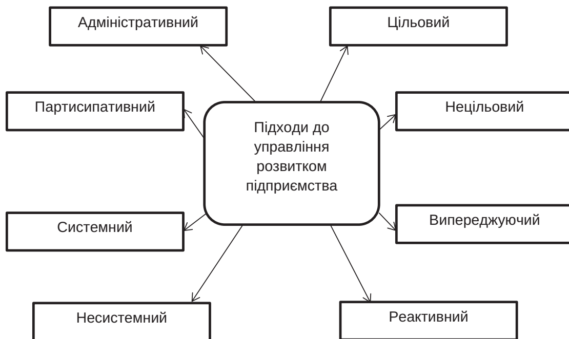
Рис. 1. Підходи до управління розвитком підприємства

На практиці управління трансформується в ціленаправлену і організаційну систему, яка