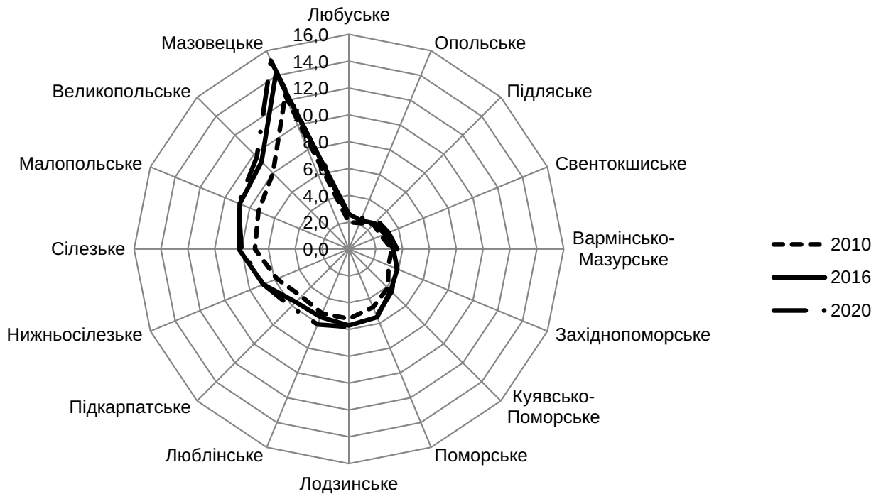
Рис. 2. Динаміка кількості громадських організацій в регіонах Польщі протягом 2010–2020 рр., тис.од.