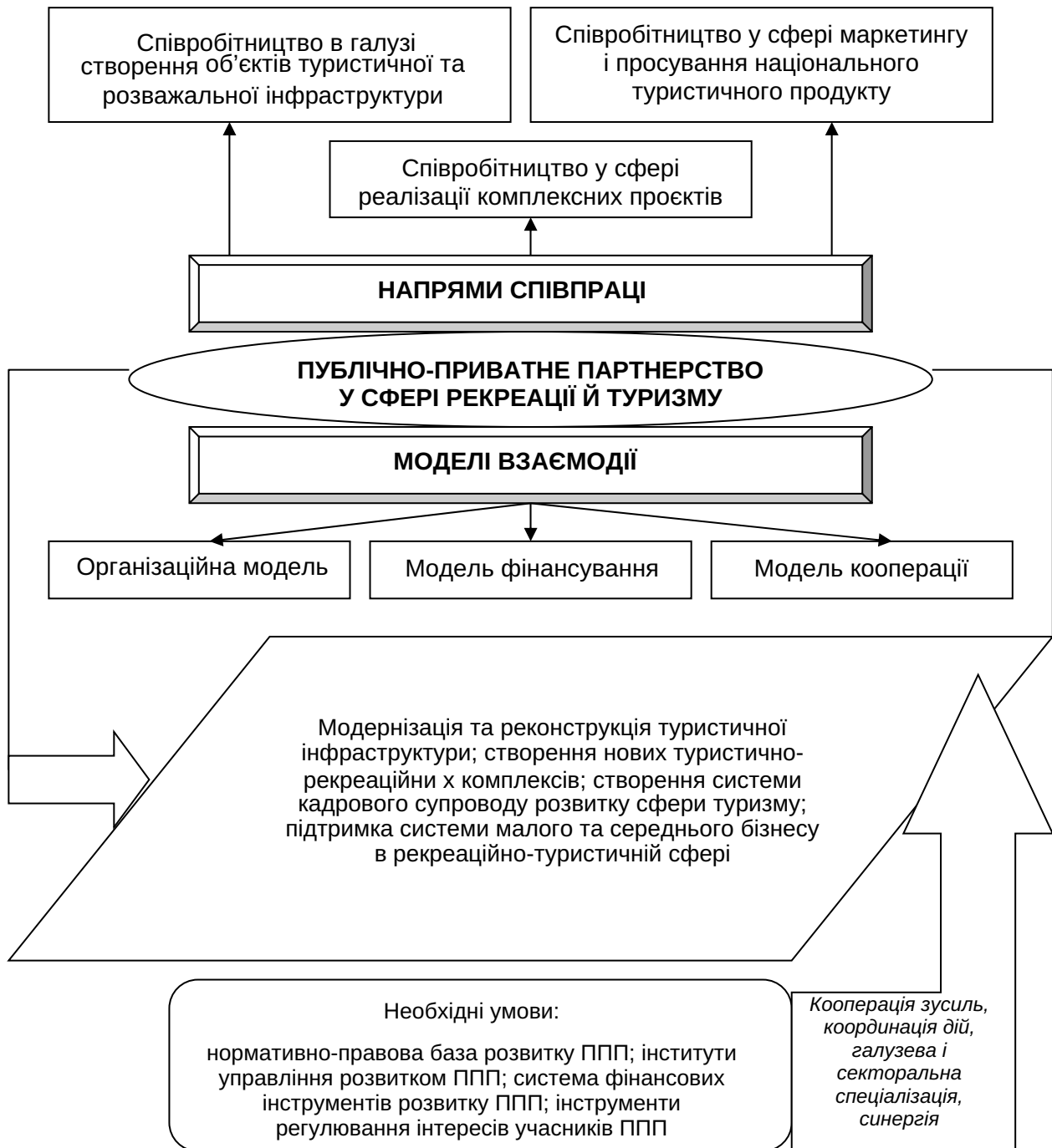
Рис. 1. Основні передумови, напрями співпраці, моделі і результати взаємодії публічного і приватного секторів у сфері рекреації й туризму