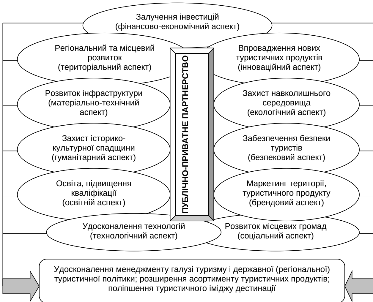
Рис. 3. Основні сектори (аспекти) розвитку ППП у сфері рекреації й туризму та результати їх практичної реалізації