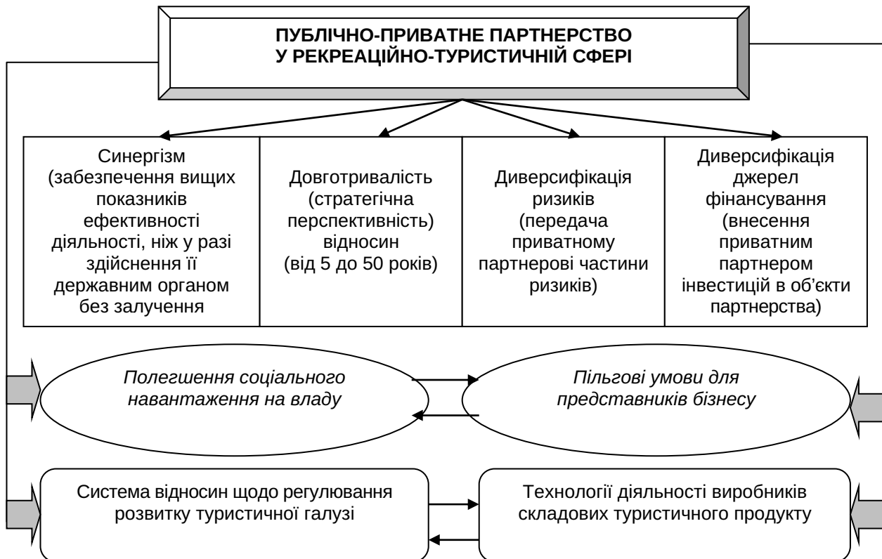
Рис. 2. Принципи, що розкривають змістовну сутність і синергізм публічно-приватного партнерства у рекреаційно-туристичній сфері

Джерело: складено автором на основі [4, с. 100; 7; 15, с. 247]