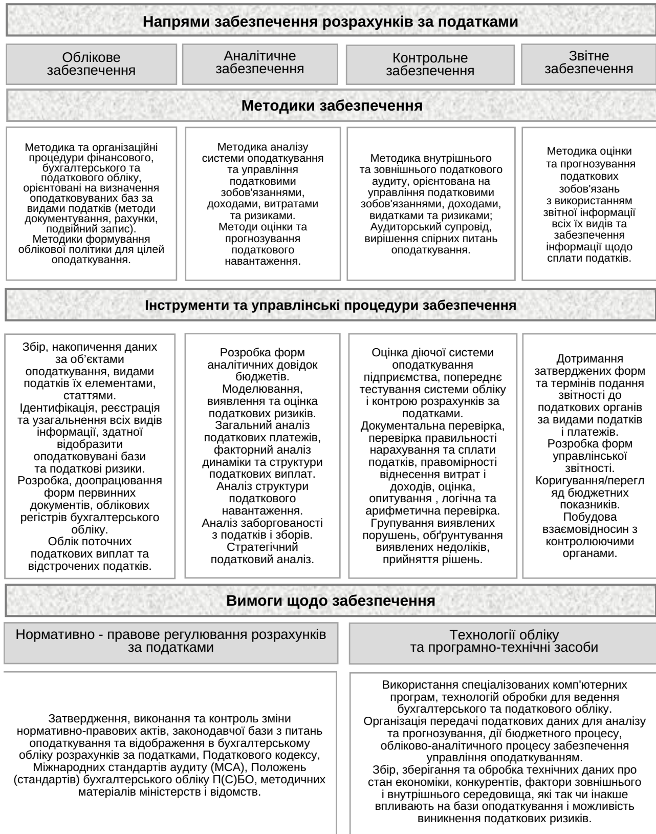
Рис. 2. Організаційно-інформаційна модель обліково-аналітичного забезпечення розрахунків за податками