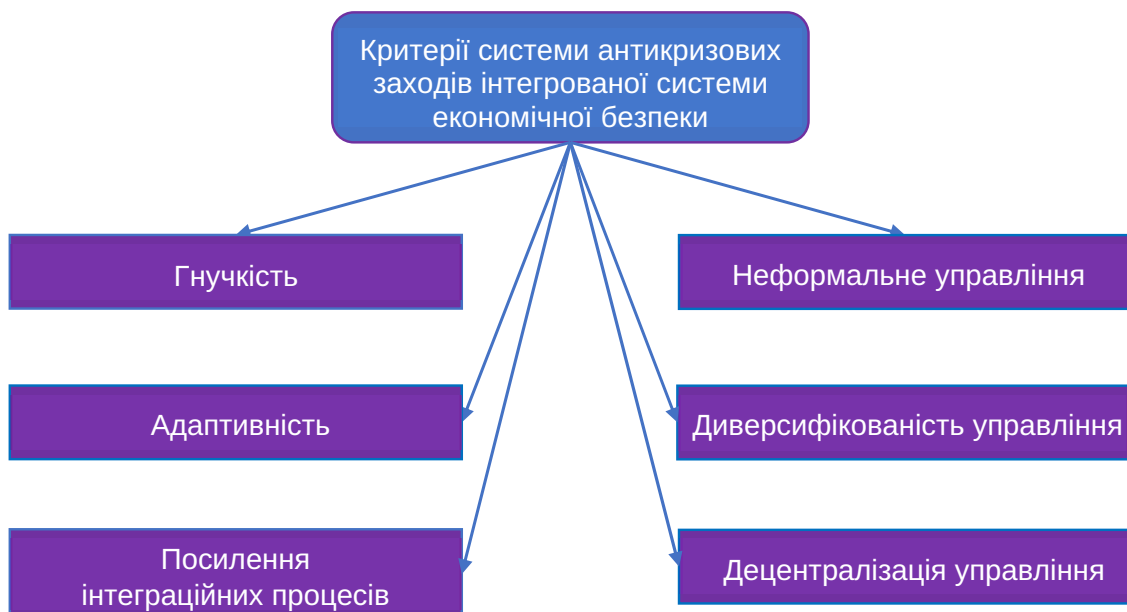
Рис. 1. Цільові характеристики комплексу антикризових заходів інтегрованої системи економічної безпеки держави

З іншого боку, не варто відкидати і базові підходи до визначення інструментарію впливу на макроекономічні процеси, згідно з якими усі методи варто розподіляти на тактичні та