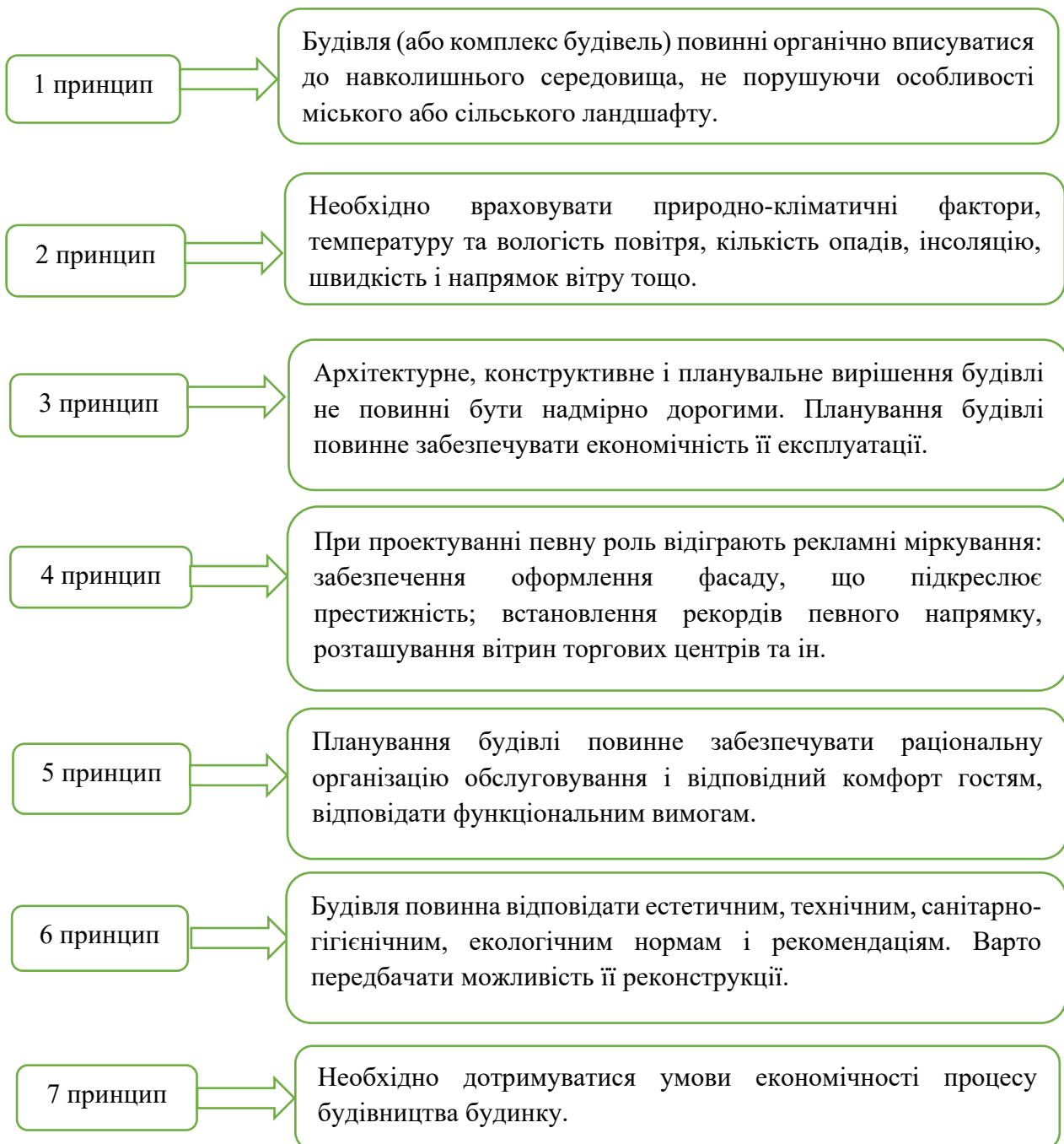
Рис. 1. Основні 7 принципів, що використовуються при спорудженні підприємств готельно-ресторанного господарства