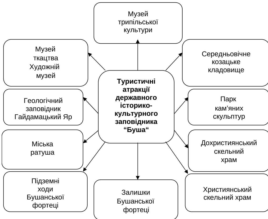
Рис. 1. Туристичні атракції державного історико-культурного заповідника «Буша» [3]

диці, вже почали будувати у 1846 році, а закінчили у 1865 році.