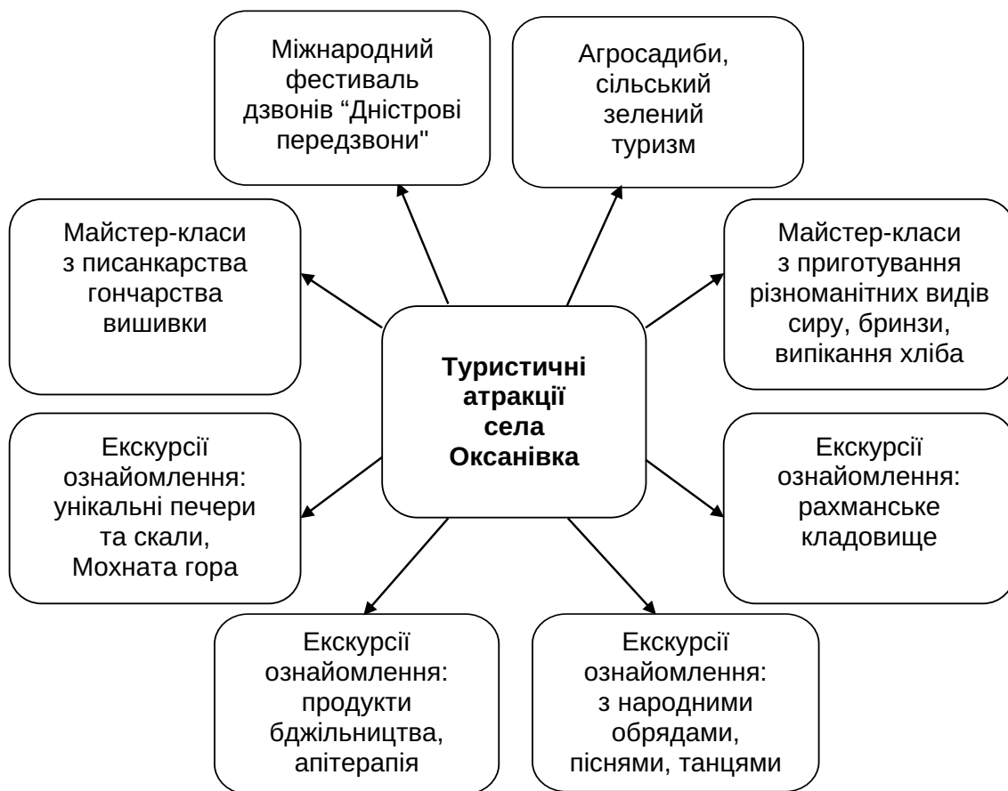
Рис. 4. Туристичні атракції села Оксанівки Ямпільського району

Зокрема, присутні оглянули садибу «Подільська родина» та прийняли участь у майстер-класах з виготовлення «янголів» з місцевих трав та випіканні «чарівних жайворонків» з тіста. Також ознайомились з