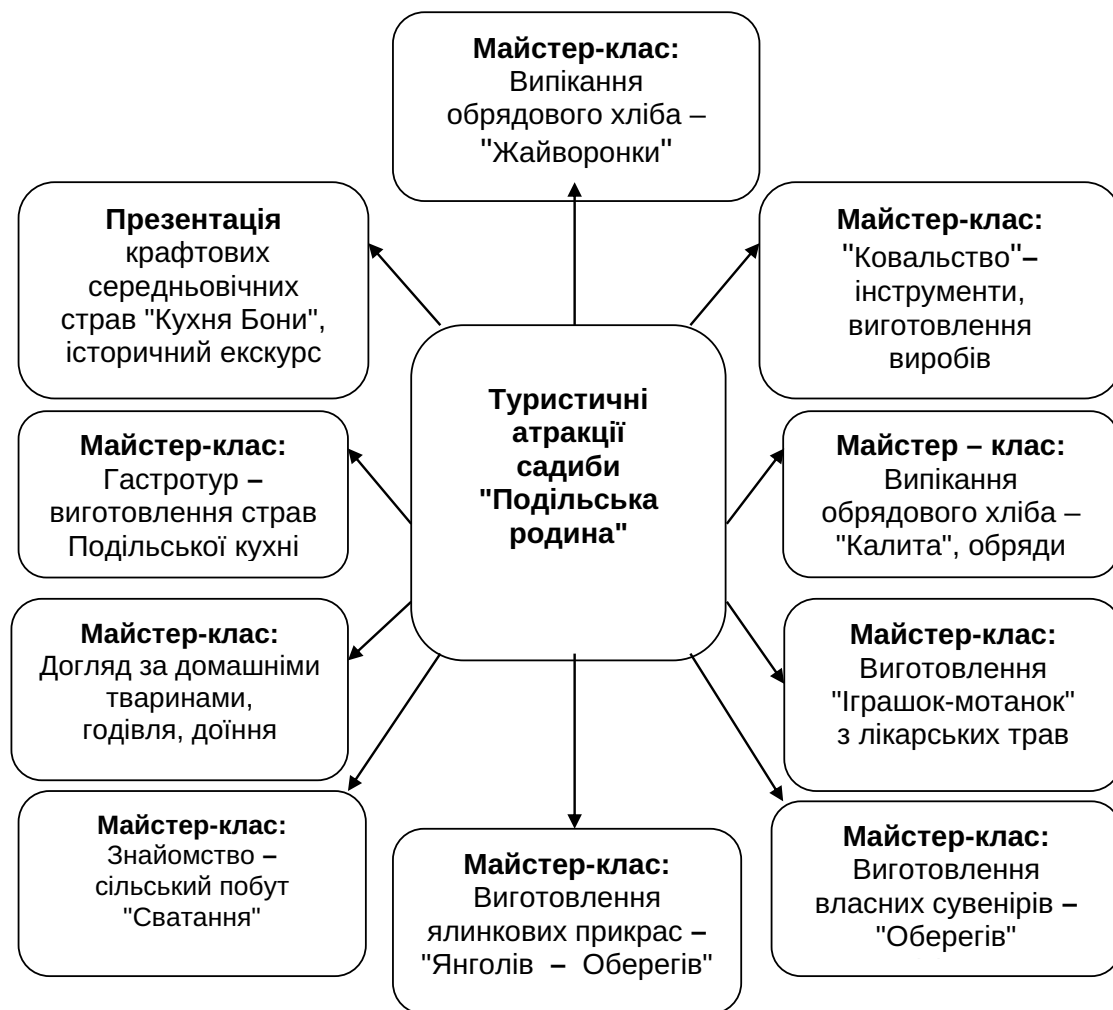
Рис. 5. Туристичні атракції садиби «Подільська родина»

Проєкт міжнародної технічної допомоги «Партнерство для розвитку міст» (Проєкт «ПРОМІС») спрямовано на зміцнення муніципального сектору в Україні, впровадження ефективного демократичного управління та прискорення економічного розвитку шляхом підвищення спроможності українських міст у сфері демократизації врядування та місцевого економічного розвитку; створення сприятливого середовища для розвитку малого та середнього бізнесу; підтримку процесу децен-