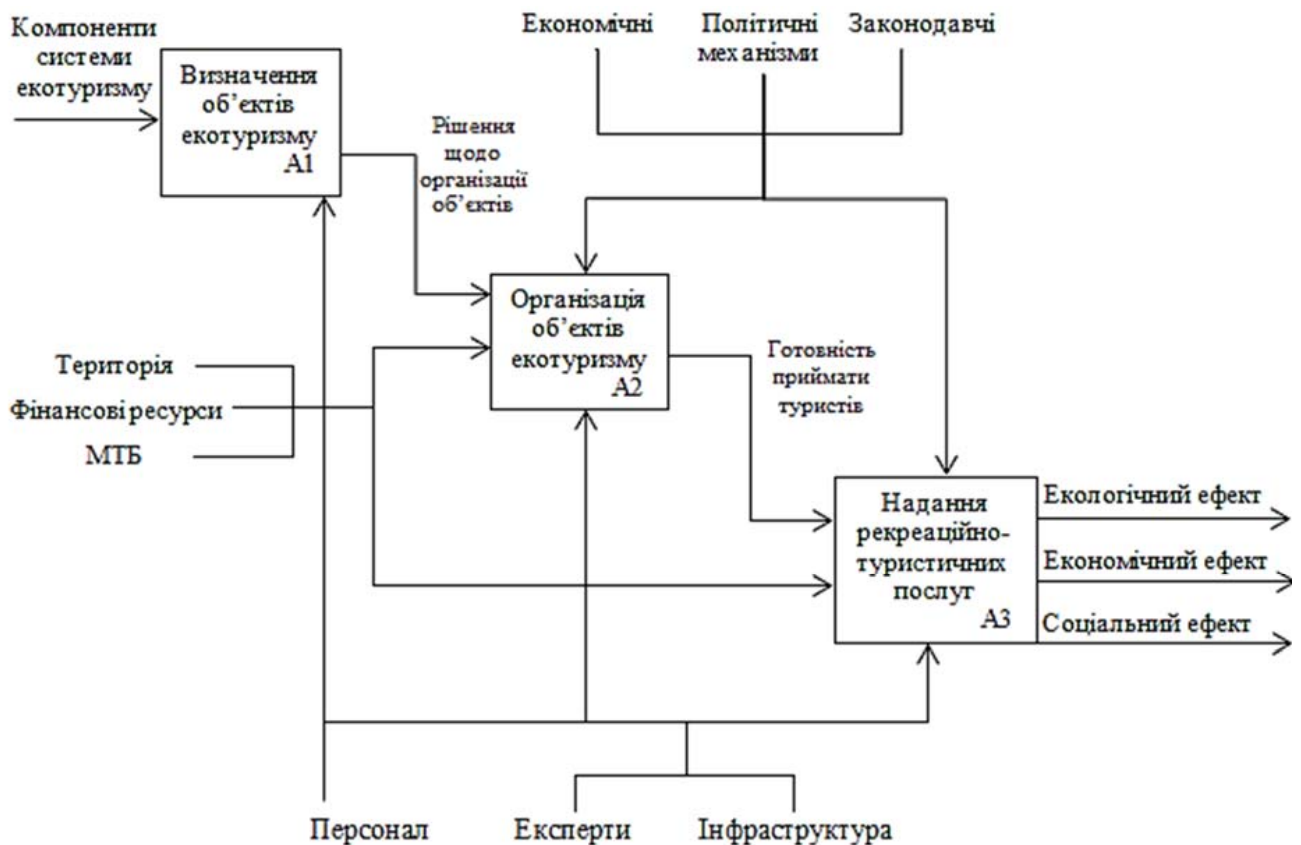
Рис. 2. Декомпозиція контекстної діаграми в стандарті IDEF0