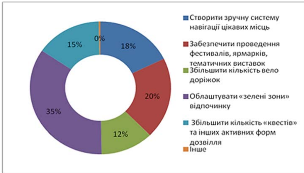
Рис. 3. Побажання респондентів щодо покращення умов комфортного і цікавого проведення дозвілля