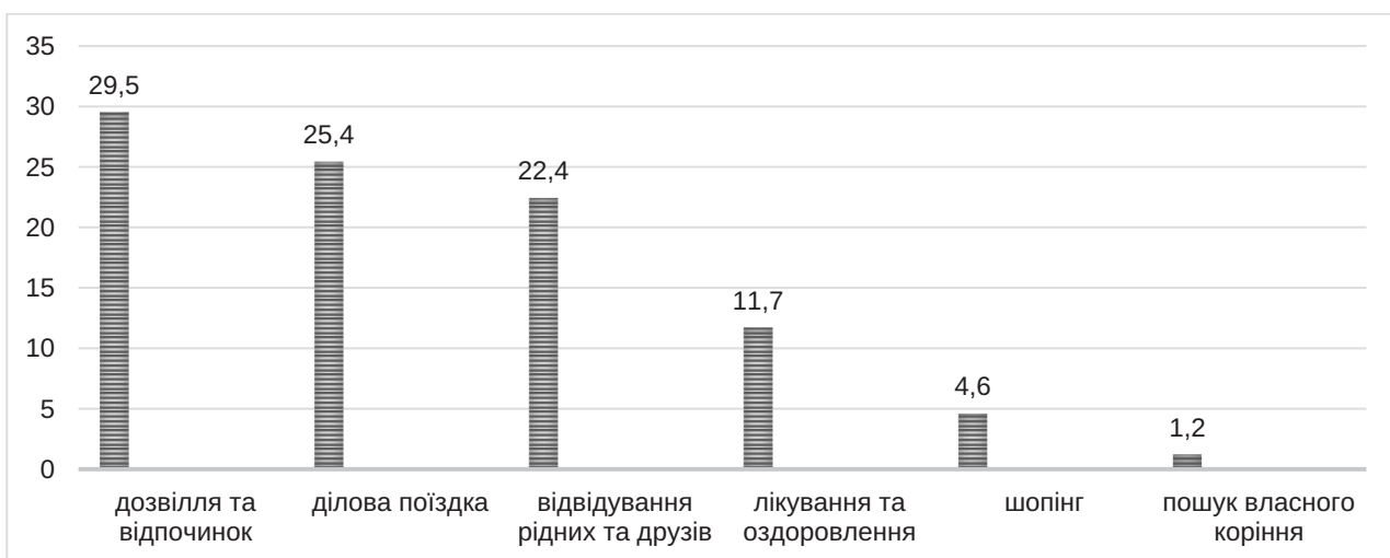
Рис. 2. Динаміка розподілу туристів за метою поїздки в Україну