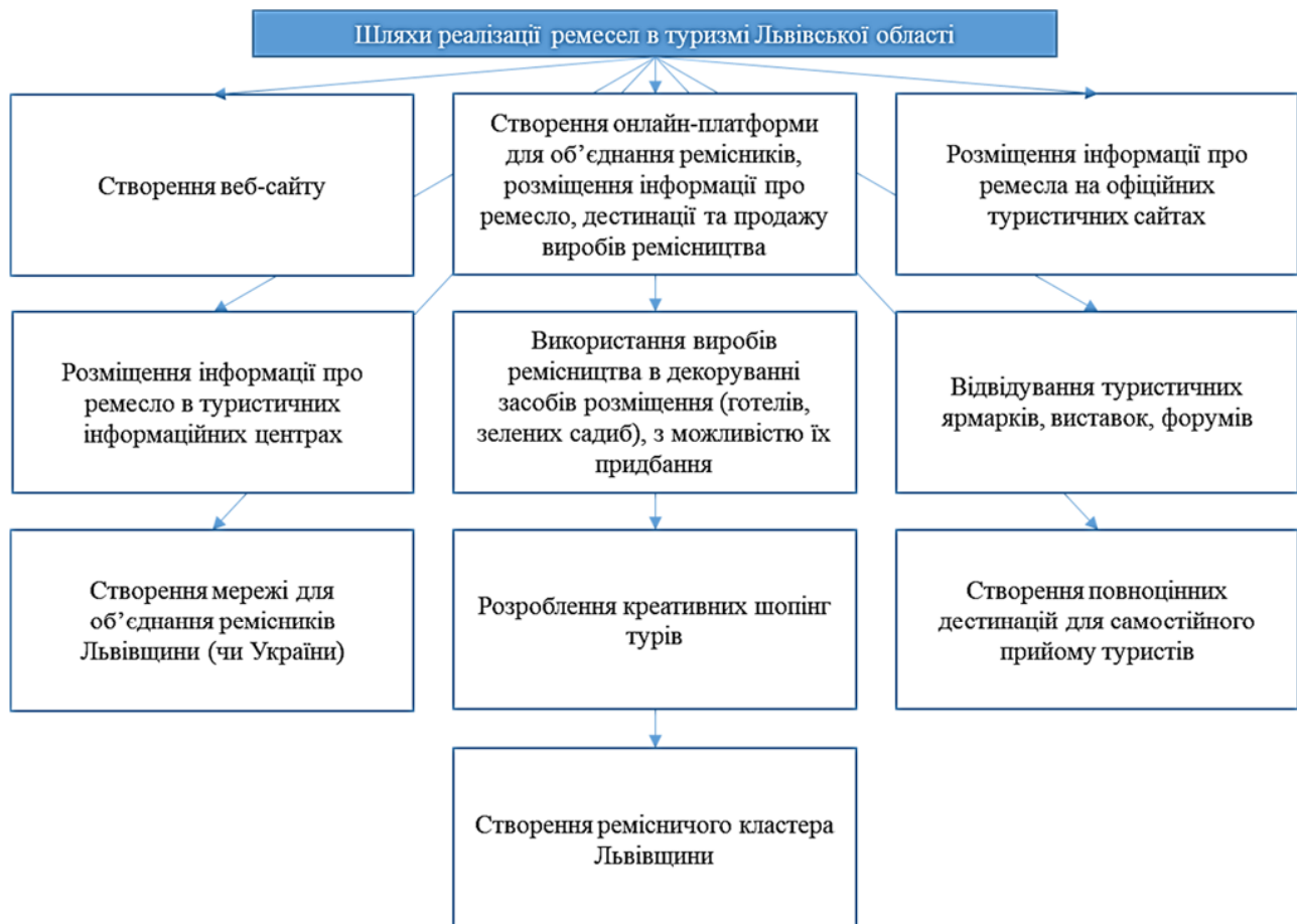
Рис. 1. Шляхи реалізації ремесел в туризмі Львівської області

Доцільно розміщувати інформаційно-рекламні матеріали про діяльність в туристичних інформаційних центрах. Декілька туристичних інформаційних центрів діють у Львові (на Площі Ринок 1, в аеропорту, терміналі А та на головному залізничному вокзалі [9], також у Жовкві [8] та Дрогобичі [7]. Також