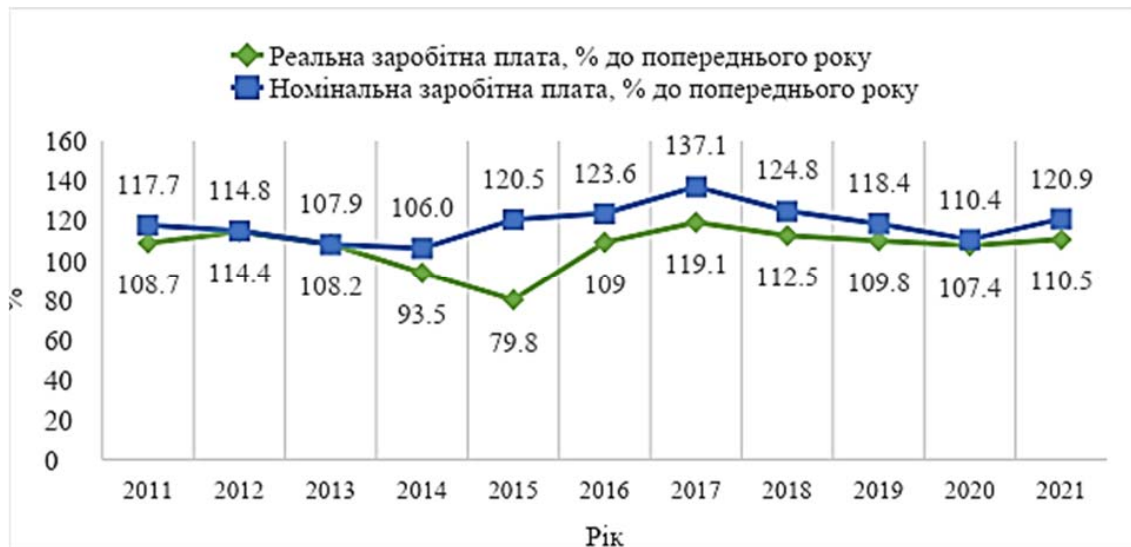
Рис. 3. Темпи зростання (зниження) номінальної та реальної заробітної плати в Україні за 2011–2021 рр.

номінальної та реальної заробітної плати. За статистикою, розрив між реальною та номінальною заробітною платою був найменшим у 2012 та 2013 роках. Найбільший розрив показує показник 2015 року, найнижчою цього року є реальна заробітна плата з відхиленням від номінальної на 40,7%. Таку негативну тенденцію можна пояснити подіями з кінця 2013 року. Фінансово-економічна криза в Україні відзначалася значною інфляцією. За 2021 рік індекс реальної зарплати зріс на +10,5% щодо попереднього року.