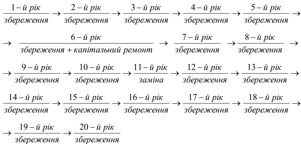
Рис. 2. Програма відновлення та заміни екскаватора під час використання методу зменшення залишкової вартості

Нині на Інгулецькому гірничо-збагачувальному комбінаті застосовується прямолінійний метод амортизації. Окрім того, підприємство за браком коштів намагається вирішити проблему відновлення виробничих засобів за рахунок ремонтів, тому за умов роботи під-