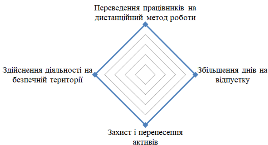
Рис. 2. Основні завдання щодо мінімізації негативного впливу військових дій на підприємницьку діяльність в Україні

рів досягнення економічного успіху. Але це не можливо досягнути, якщо йдуть військові дії. Україна прагне свободи і мирного соціально-економічного життя, де підприємницька діяльність буде стабільною та вигідною.