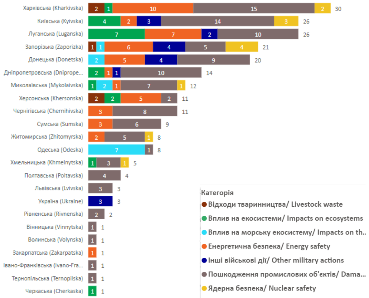
Рис. 2. Кількість екозлочинів росії на території України станом на 05.05.2022 р.

Джерело: Міністерство захисту довкілля та природних ресурсів України, ГО Екодія [3; 7]