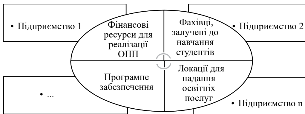
Рис. 2. Концептуальна модель ТЦ, створеного на умовах об'єднання ресурсів учасників промислового кластера

фесійних програм. Комплекс освітніх компонентів, які він включатиме (дисциплін, індивідуальних завдань, контрольних заходів), відповідатиме нагальним вимогам практики, а отримані студентом компетенції – актуальним професійним стандартам роботодавців. Більш того, ТЦ у запропонованій формі уможливить підвищення рівня знань співробітників підприємств та набуття практичних навичок викладачами закладів освіти, які залучені до дуальних програм. Тож маємо ще одне свідчення на користь зробленої пропозиції.