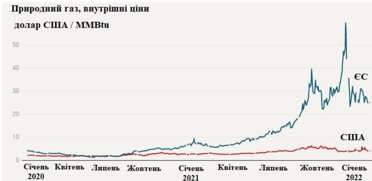
Рис. 6. Тенденція зростання цін на природний газ у Європі та США