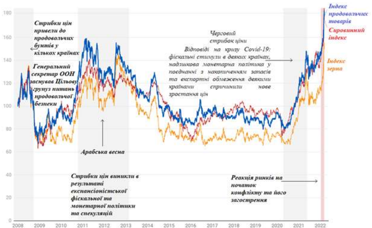
Рис. 3. Взаємозв'язок між стрибками цін на продукти харчування та політичною нестабільністю