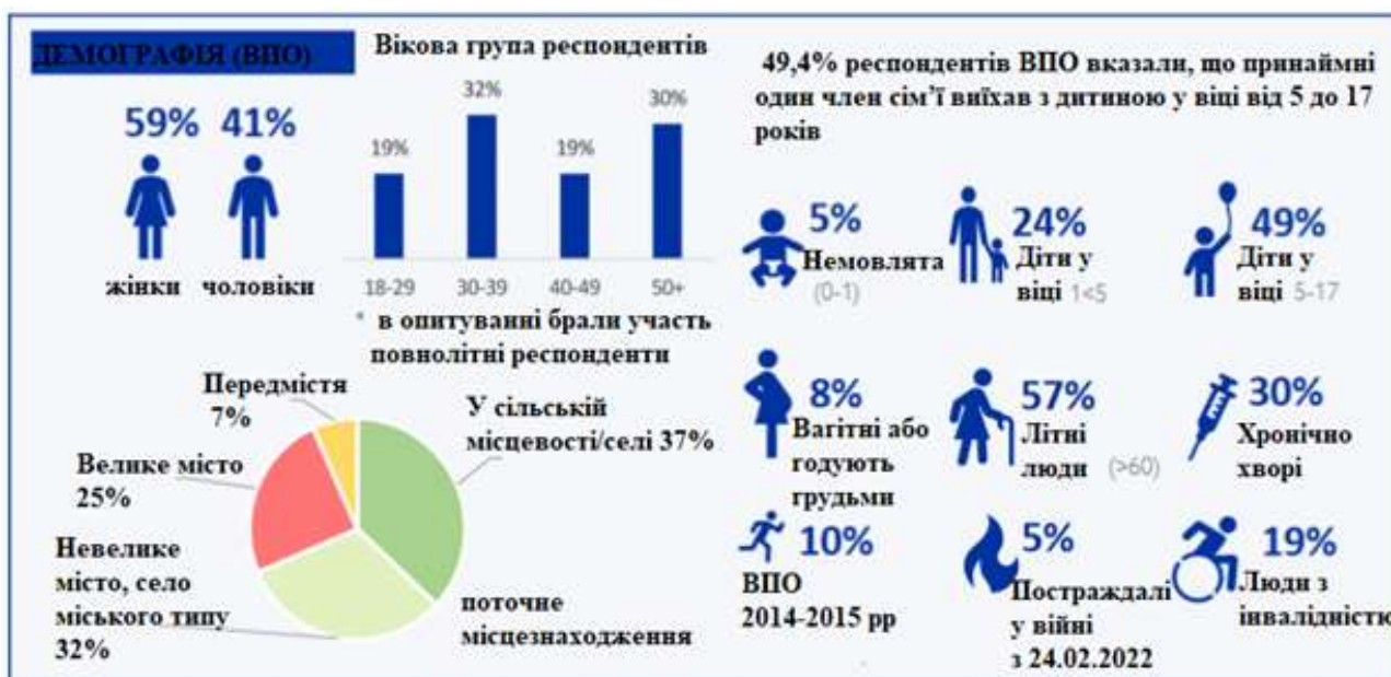
Рис. 5. Демографічна структура ВПО