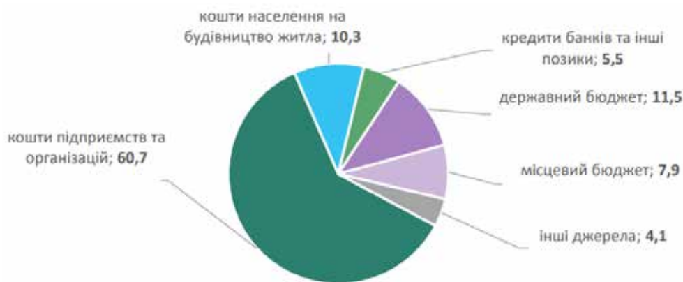
Рис. 3. Структура капітальних вкладень за джерелами фінансування у Львівській області у 2021 році