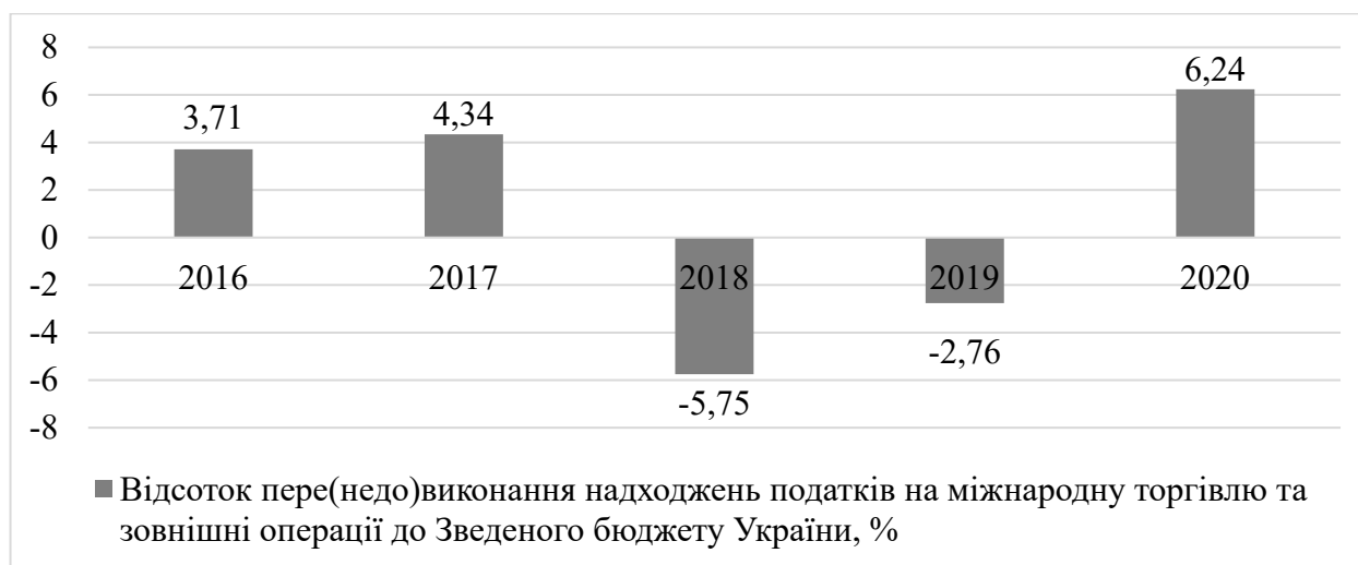
Рис. 2. Оцінка показників пере- або недовиконання Зведеного бюджету України у розрізі податків на міжнародну торгівлю та зовнішні операції протягом 2016–2020 рр., %

Сьогодні є ціла низка проблем, які заважають лібералізації міждержавних економічних