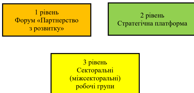
Рис. 2. Рівні системи координації міжнародної технічної допомоги