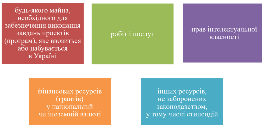
Рис. 1. Способи залучення міжнародної технічної допомоги

Стратегічна платформа проводиться під співголовуванням Віце-прем'єр-міністра з питань європейської та євроатлантичної інтеграції України або уповноваженої особи Секретаріату Кабінету Міністрів України та