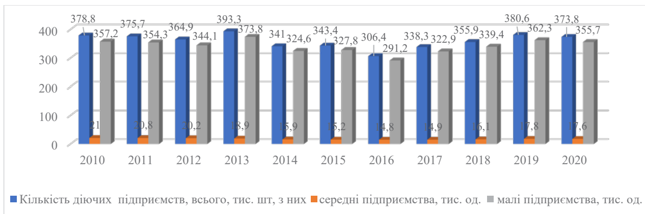
Рис. 1. Динаміка чисельності підприємств в економіці України