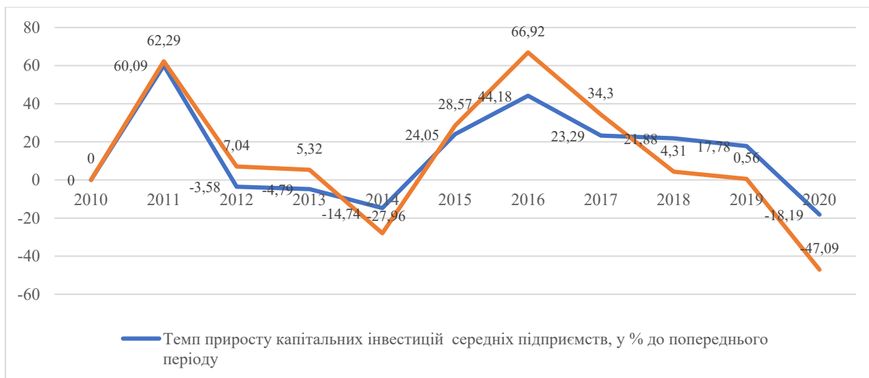
Рис. 4. Динаміка темпів приросту капітальних інвестицій МСП