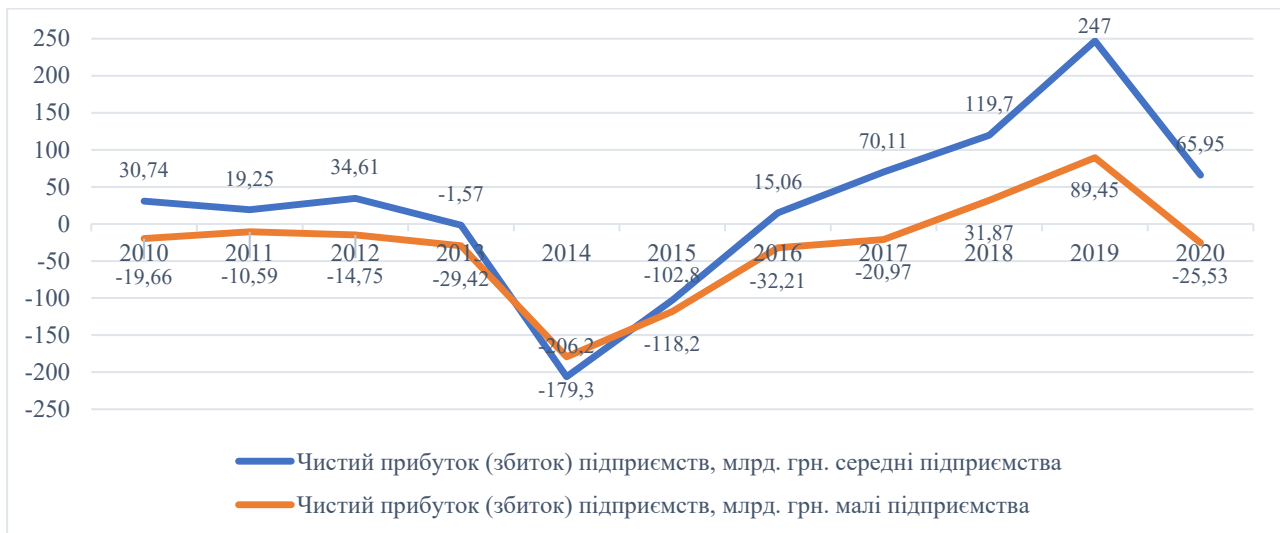
Рис. 5. Динаміка обсягу чистого прибутку МСП 2010–2020 рр.