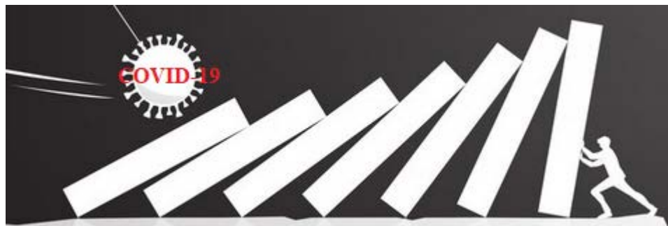
Рис. 3. Ланцюгова реакція від поширення COVID-19