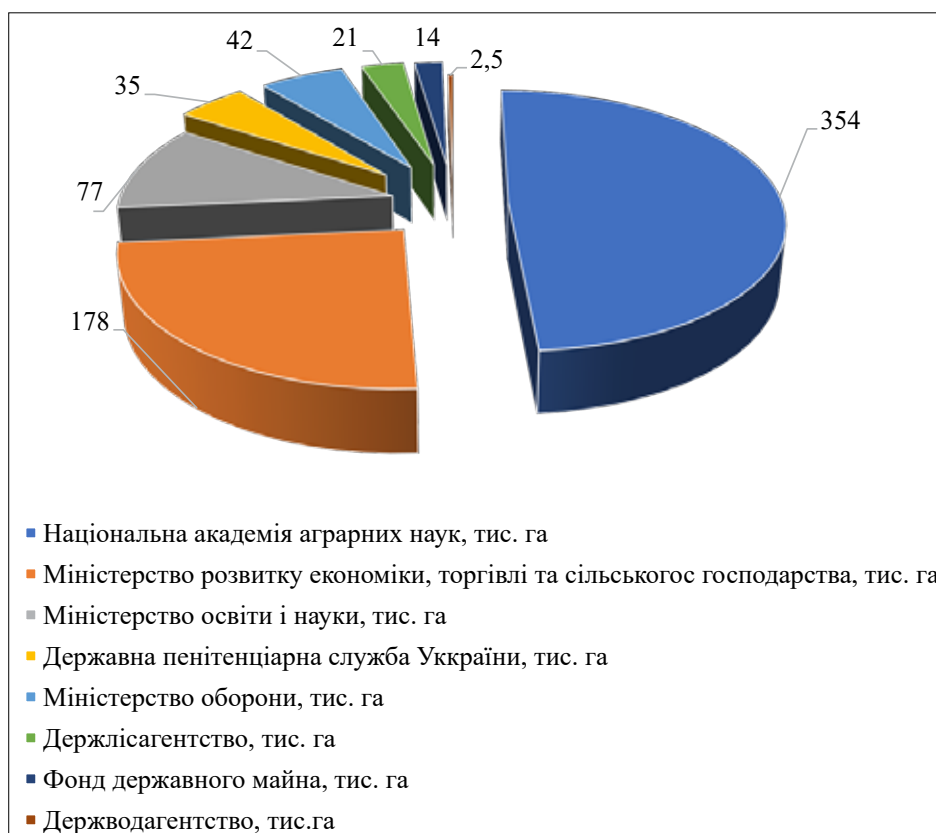
Рис. 2. Розподіл земель сільськогосподарського призначення між державними підприємствами та установами

Шостий етап – державна реєстрація права комунальної власності на земельні ділянки за територіальною громадою в особі відповідної місцевої ради. Так, статтями 125, 126 ЗК передбачено, що право власності на земельну ділянку, а також право постійного користування та право оренди земельної ділянки виникають з моменту державної реєстрації цих прав [5]. Право власності, користування земельною ділянкою оформлюється відповідно до Закону України від 01.07.2004 № 1952-IV «Про державну реєстрацію речових прав на нерухоме майно та їх обтяжень» [10].