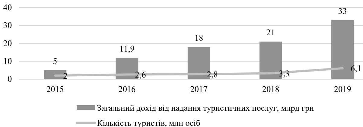
Рис. 4. Доходи туристичної галузі та чисельність туристів у 2015–2019 рр.