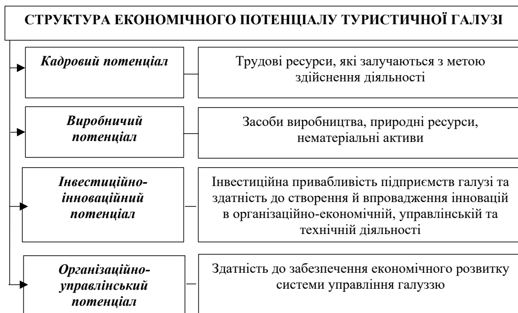
Рис. 2. Структура економічного потенціалу туристичної галузі

В 2020 році в Україні в зв'язку з пандемією COVID-19, відбулося значне падіння прибутків туристичної галузі на рівні 60–80% порівняно з 2019 роком. Загальні туристичні потоки в 2020–2021 рр. демонструють значну негативну тенденцію, але найбільшого збитку зазнали мережі готелів, музеї та сана-