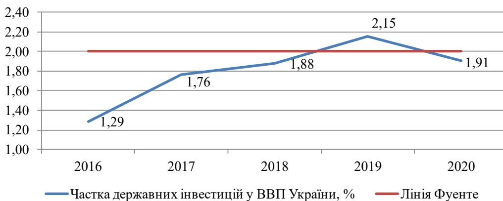
Рис. 1. Динаміка частки капітальних бюджетних інвестицій у ВВП в Україні

Негативною тенденцією, як видно з даних табл. 1, є нестабільність обсягів фінансування інвестицій та існування коливань аналізованих показників в розрізі конкретно взятих років. По структурі джерел фінансування капітальних інвестицій (рис. 2) переважають власні кошти підприємств і організацій з тенденцією до зниження (-2,9%), а кошти бюджету – становлять незначну частку, однак продовжують зростати з 9,4% (2016 р.) до 19,1% (2020 р.).