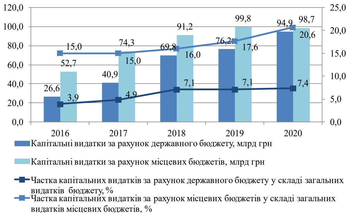
Рис. 3. Динаміка капітальних видатків з державного й місцевих бюджетів України впродовж 2016–2020 рр.