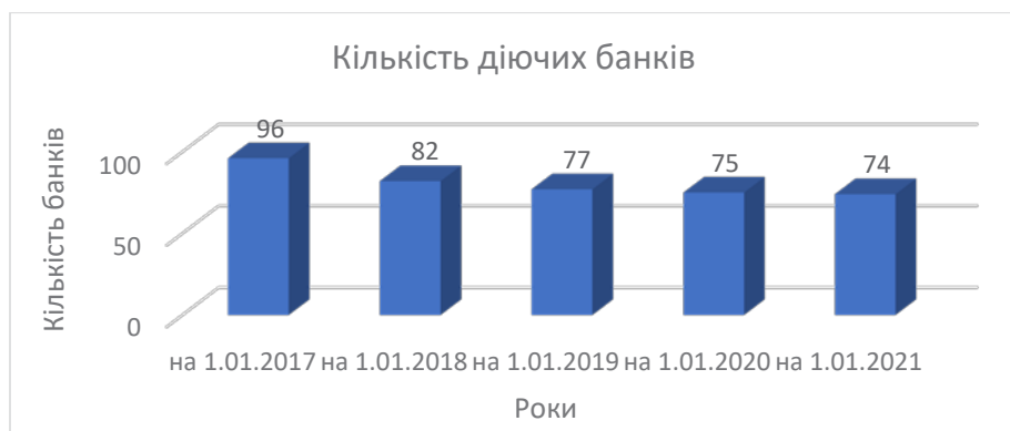
Рис. 3. Кількість діючих банків (2017–2021)

Проте для України такі масштабні трансформації у функціонуванні банківського сектору ЄС створюють реальну проблему у майбутньому через виникнення значних інституційних прогалин та невідповідність офіційно закріплених в Угоді завдань від реальної практики Єдиного ринку ЄС, що, безумовно, може зробити нереальною перспективу інтеграції в єдиний ринок у частині положень, що належать до банківського сектору, бо за Додатком XVII інтеграційний шлях до права ЄС певним чином втратив свою актуальність, адже самим ЄС було ретельно переглянуто ключові положення у сфері банків.