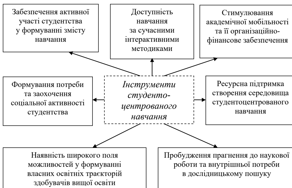
Рис. 2. Характеристика основних інструментів студентоцентрованого навчання

Сучасний викладач має вкладати новий зміст у свою функцію керівника і консультанта студента для кращого засвоєння ними знань. Повинен забезпечуватися якісно вищий рівень мотивування та консультування студентів у ході підбору ними навчальної літератури, опрацювання необхідної інформації, закріплення здобутих знань на практичних заняттях. При цьому викладач виступає не тільки керівником, але й партнером, що вимагає побудови як вертикальних, так і горизонтальних зв'язків та каналів комунікації. Такий підхід дозволяє не обмежувати, а навпаки, спонукати студента до самостійних дій, готовності до постійного самовдосконалення на