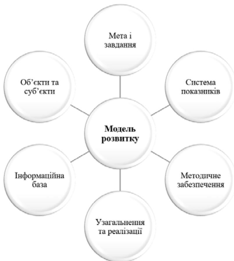
Рис. 2. Організаційно-інформаційна модель розвитку господарської діяльності підприємств харчової промисловості