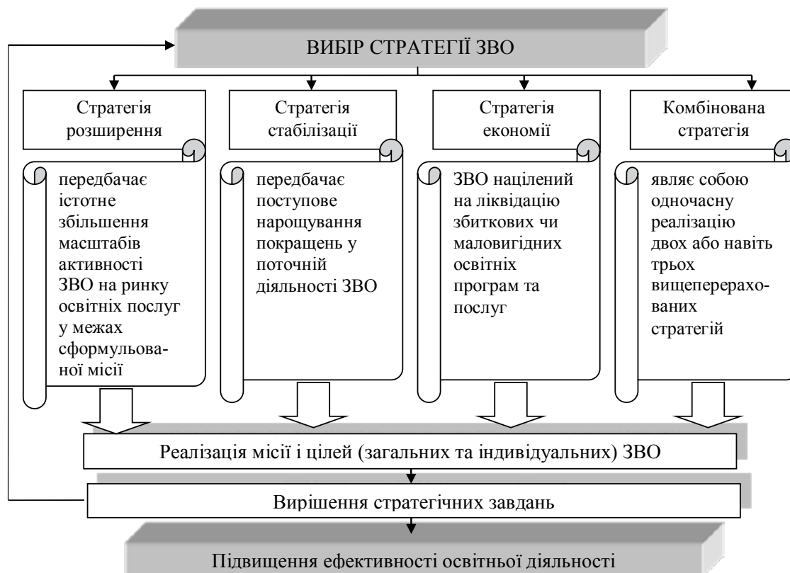
Рис. 2. Процес формування стратегії ЗВО для підвищення ефективності освітньої діяльності [16]

Основними завданнями ЗВО є: задоволення потреби особистості в інтелектуальному, культурному й етичному розвитку за допомогою отримання вищої та післядипломної професійної освіти; задоволення потреби суспільства і держави у кваліфікованих фахівцях із вищою освітою та науково-педагогічних кадрах вищої кваліфікації; організація і проведення фундаментальних та прикладних наукових досліджень, інших науково-технічних, дослідно-конструкторських робіт, у тому числі з проблем освіти; розвиток наук і мистецтв за допомогою наукових досліджень та творчої діяльності науково-педагогічних працівників і студентів, використання отриманих результатів в освітньому процесі; підготовка, професійна перепідготовка і підвищення кваліфікації фахівців та керівних працівників; накопичення, збереження і примноження моральних, культурних та наукових цінностей суспільства; поширення знань серед насе-