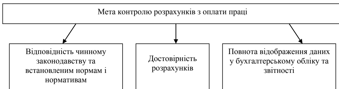
Рис. 1. Мета контролю розрахунків з оплати праці