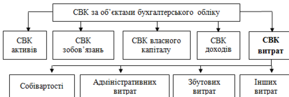
Рис. 1. Об'єктна багаторівнева модель СВК