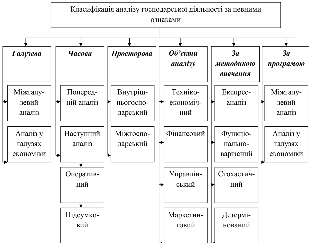
Рис. 2. Класифікація аналізу господарської діяльності [9, с. 29]

ним дослідженням усіх наявних процесів основної діяльності підприємства та їх структурних підрозділів. Перш за все для аналізу потрібно визначити причино-наслідкові зв'язки та тенденції розвитку з метою обґрунтування управлінських стратегічних поточних рішень та оцінки їх ефективності. Цього можна досягти за його інтенсивного використання із застосуванням основних видів та завдань. Здійснення аналізу господарської діяльності надає можливу інформацію про ефективність діяльності підприємства, за допомогою якої ми зможемо проаналізувати та вирішити подальші дії, можливості для кращого та ефективного кінцевого результату діяльності. Використання аналітичних процесів дає змогу відстежувати розвиток підприємства за його основними показниками. Наведені етапи розвитку аналізу допомагають виявити сутність та характеристику проведення в сучасних умовах аналітичної роботи, що приводить до пошуку резервів та усунення негативних чинників для підвищення ефективності прийняття управлінського рішення та кінцевих результатів господарювання суб'єкта.