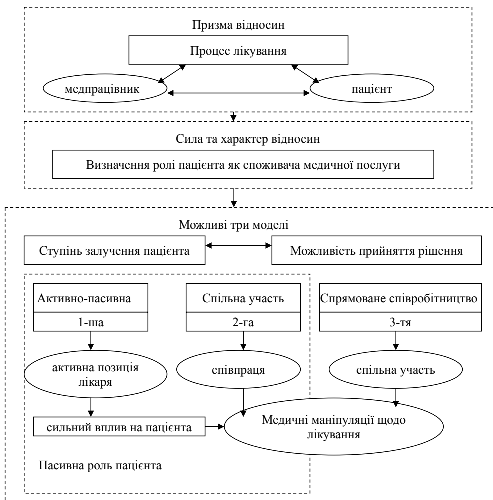
Рис. 3. Участь пацієнта у лікувальному процесі