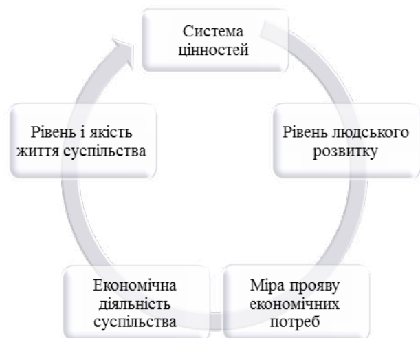
Рис. 2. Циклічність процесу формування національного добробуту

номічну діяльність суспільства, яка визначає рівень та якість життя його членів, що закладають основу для формування системи цінностей, і так далі (рис. 2).