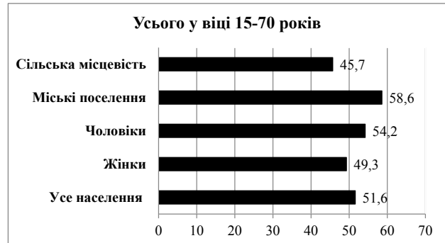
Рис. 2. Рівень зайнятості населення Тернопільської області у віці 15–70 років

За даними рис. 2, рівень зайнятості всього населення у віці 15–70 років становить 51,6%, чоловіків – 54,2%, жінок – 49,3%. Рівень зайнятості у міських поселеннях становить 58,6%, а в сільській місцевості – 45,7%, що нехарактерно для нашого регіону, оскільки в області протягом тривалого періоду більша частка працездатного населення припадала на сільську місцевість.