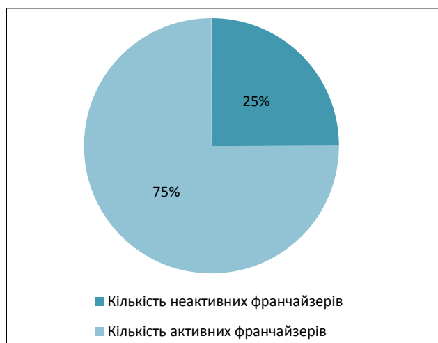
Рис. 3. Кількість активних та неактивних франчайзерів в Україні на 2015 рр.