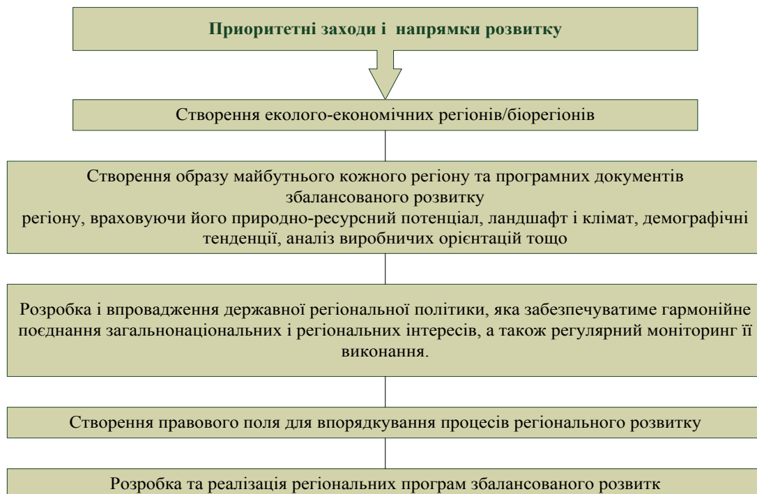
Рис. 2. Алгоритм переведення пріоритетів стратегічного розвитку країни за територіальним принципом

У цій справі не може бути взірцем будь-яка зарубіжна модель, бо кожна з них формується на власному національному ґрунті. Спроби реалізувати в Україні зарубіжні моделі ведуть у глухий кут, до створення штучних регіональних систем на шкоду національній цілісності. Насамперед слід удосконалювати територіальне управління, що передбачає координацію діяльності в межах формально наявного, але директивно не оформленого економічно-господарського районування. Слід мати на увазі, що кожен регіон має свої специфічні проблеми у розвитку господарства, соціально-культурній та екологічній сферах, відмінні умови соціально-економічного становища, різний стан докільця і різні перспективи розвитку залежно від природних умов, структури господарства, ступеню концентрації промисловості тощо. Це зумовлює своєрідність цілей, завдань, і засобів вирішення економічних, екологічних та соціально-культурних проблем у конкретному регіоні. Але в цих умовах принциповим залишається положення про необхідність дотримання пріоритетів загальнодержавного значення та органічної єдності розвитку продуктивних сил регіонів із завданнями збалансованого розвитку країни в цілому. Одним із ключових питань є необхідність вибору між міжрегіональною справедливістю і загальнонаціональною ефективністю. Держава як носій загальнонаціональних інтересів має грати провідну роль у