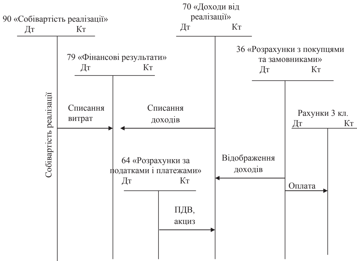
Рис. 1. Схема обліку процесу реалізації

Отже, облік процесу реалізації є складним, трудомістким процесом, тому на підприємстві він повинен бути відповідним чином роз'ясненим та описаним в обліковій політиці підприємства та посадових інструкціях вико-