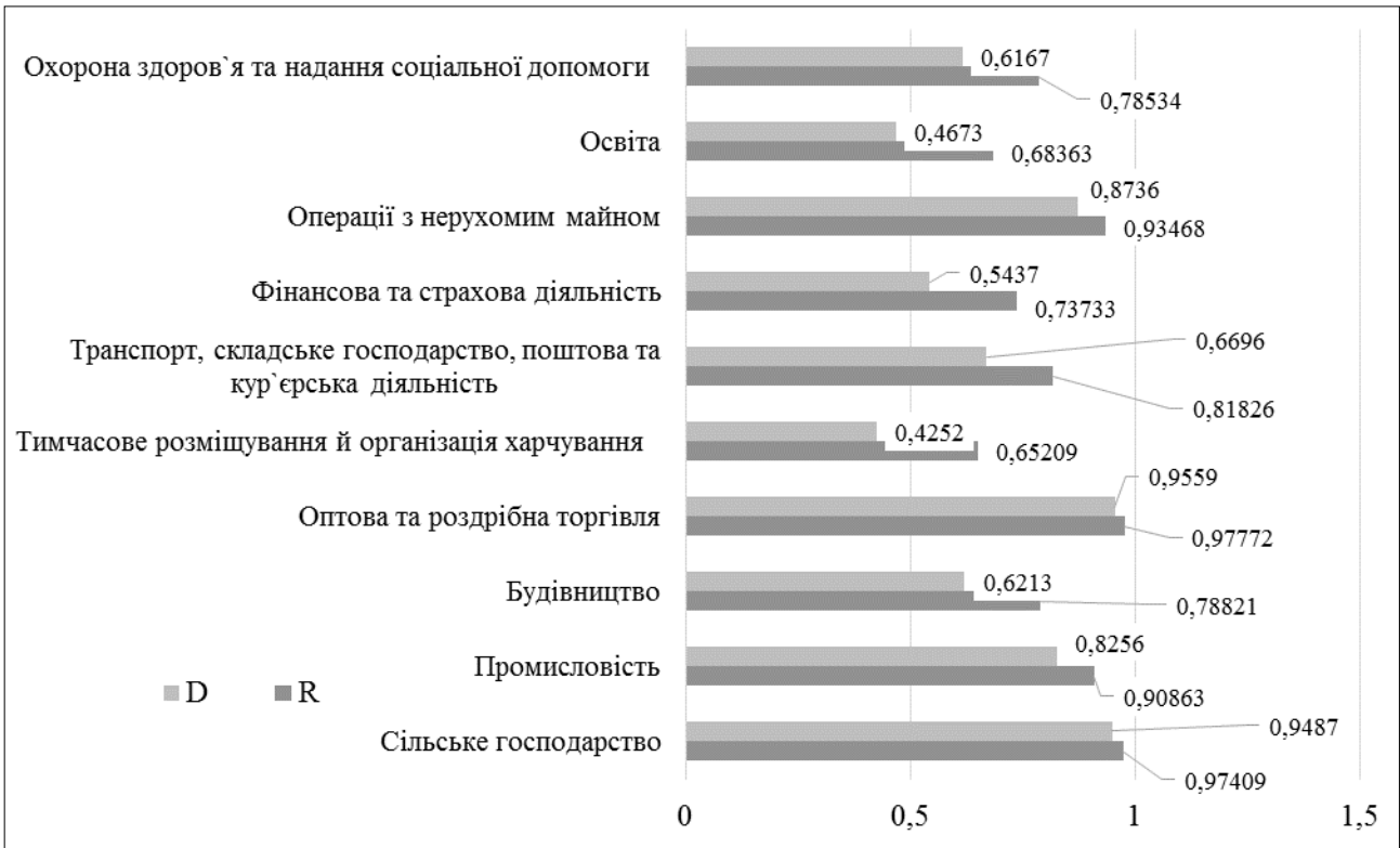
Рис. 1. Значення адекватності отриманих виробничих функцій для різних видів економічної діяльності