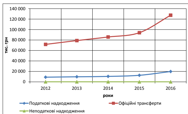
Рис. 2. Напрями зведеного бюджету Новоодеського району Миколаївської області

З 2012 по 2016 рік наповнення зведеного бюджету Новоодеського району здійснювалось за рахунок податкових надходжень, офіційних трансфертів та неподаткових надходжень (рис. 2). За цей час найбільшу питому вагу у загальній сумі дохідної частини