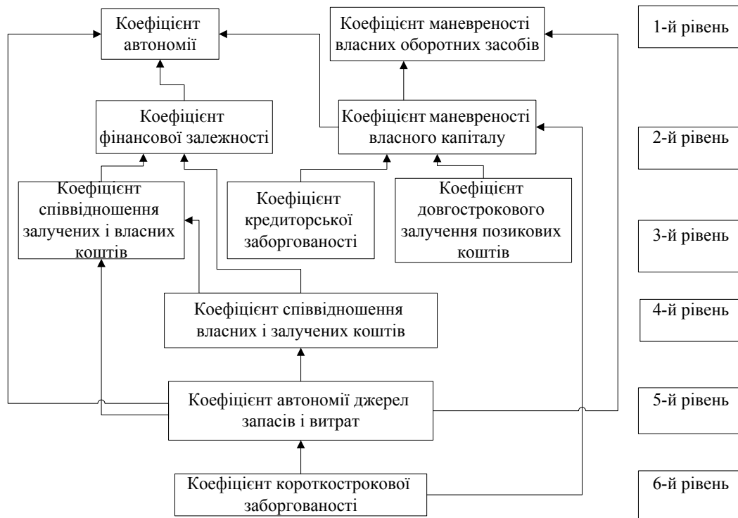
Рис. 2. Ієрархія оцінки фінансової стійкості підприємства

Відповідно до запропонованого методичного підходу до оцінки фінансового результату