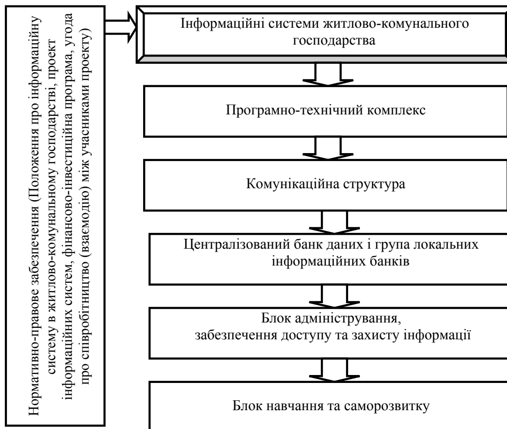
Рис. 2. Блоки багаторівневої системи управління інформаційними потоками на підприємствах житлово-комунального господарства

Для оптимізації системи управління підприємствами житлово-комунального господарства пропонується вдосконалювати муніципальне управління підприємствами житлово-комунального господарства шляхом підвищення ефективності функціонування Дирекції єдиного замовника по управлінню житловим фондом і прилеглими територіями.