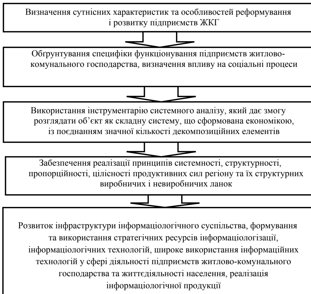
Рис. 1. Напрями підвищення ефективності управління підприємствами житлово-комунального господарства [3]

Для підвищення рівня керованості функціонування підприємств житлово-комунального господарства деякі автори зосереджують увагу на необхідності моделювання відповідних показників і процесів, що відбуваються у житлово-комунальному господарстві. Так, О.О. Євсєєва використовує методику прогнозування розвитку підприємств житлово-комунального господарства (на прикладі Харківського регіону) [4]. Для цього вона розробила відповідні моделі: лінійні, логарифмічні, поліноміальні, ступеневі, експоненціальні. Крім того, науковець для уточнення прогнозу пропонує здійснювати багатофакторний кластерний та кореляційний аналіз, що, на її думку, підвищить ефективність управління житлово-комунальними підприємствами.