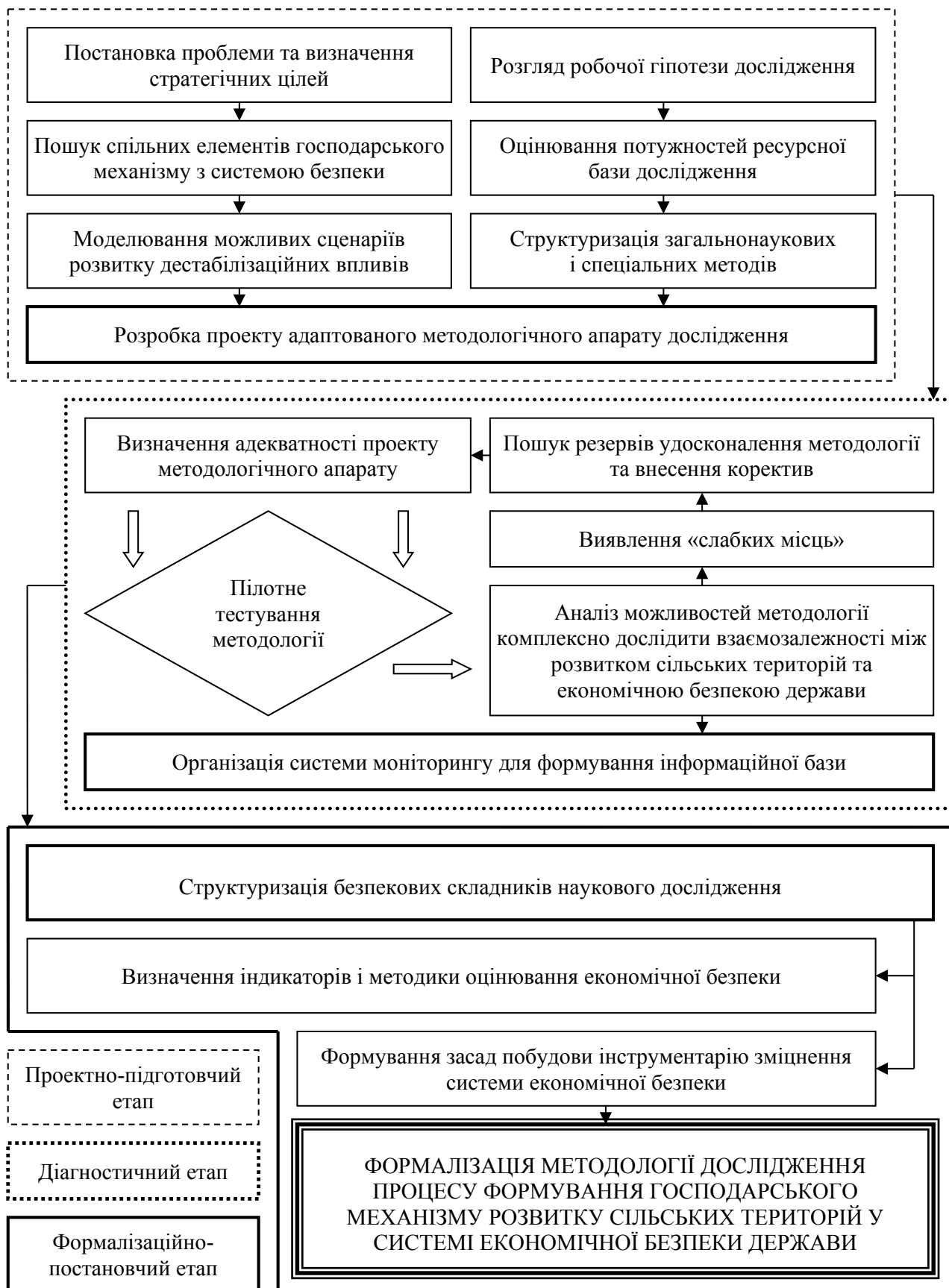
Рис. 1. Послідовність формування методології дослідження господарського механізму розвитку сільських територій у системі економічної безпеки держави