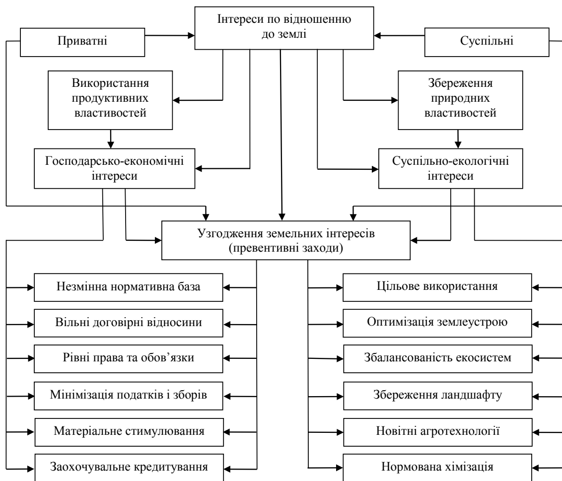
Рис. 2. Структурно-логічна модель шляхів узгодження суспільних і приватних інтересів у користуванні землями сільськогосподарського призначення

Відповідно до графічної моделі зональної динаміки зі збереження продуктивності земель (рис. 3), виокремлено потенційну (природну), нормативну (адміністративну) та ефективну (економічну) родючість ґрунту. Як можна бачити з наведеної моделі, природна