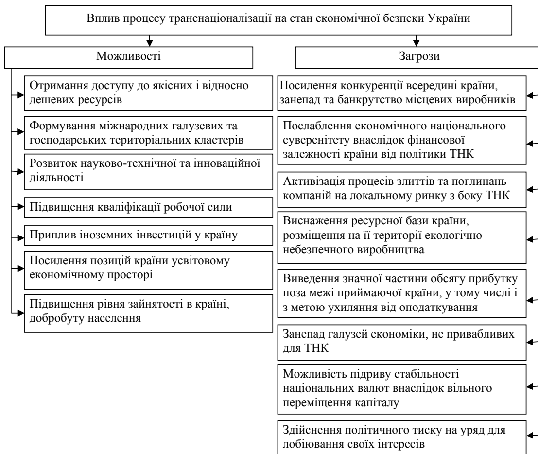
Рис. 3. Можливості та загрози процесу транснаціоналізації для економічної безпеки України